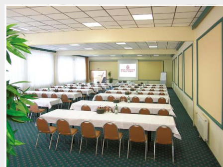
TAGUNGSRaum FRANZ JOSEF