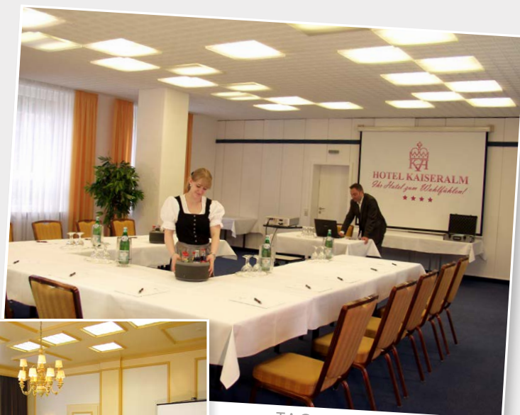
TAGUNGSRaum ST. VEIT